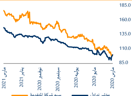
سهم شركة المتقدمة مقابل مؤشر تداول (المعاد تقديره)