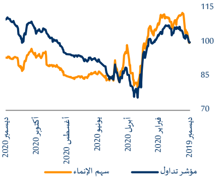
أداء سهم مصرف الإنماء مقابل مؤشر تداول (المعاد تقديرية)